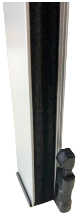
← Guida con spazzolino