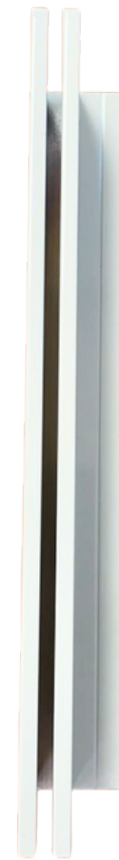
← Guida con bottoni antivento