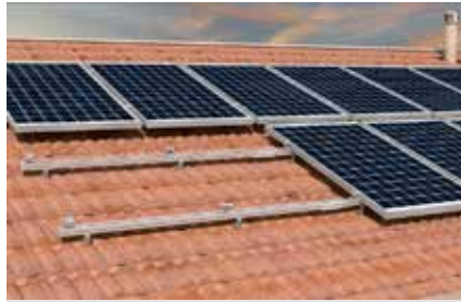
Tetto a falda