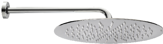
Immagine Prodotto - Product Image

Душевая лейка TETIS из стали inox, 4 мм толщина, с держателем 1/2" M x 1/2" M горизонтальным