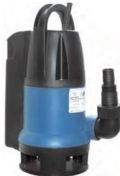
CSP-555PW Acque sporche